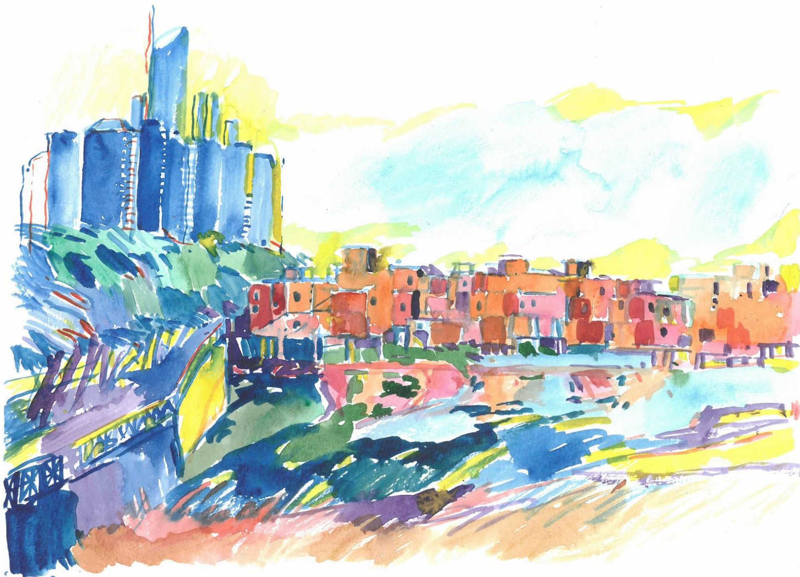
RÓDRIGO BUENO "EL MACIZO" AL PIE DE LAS TORRES (EDAD MEDIA O SIGLO XXI) 2018