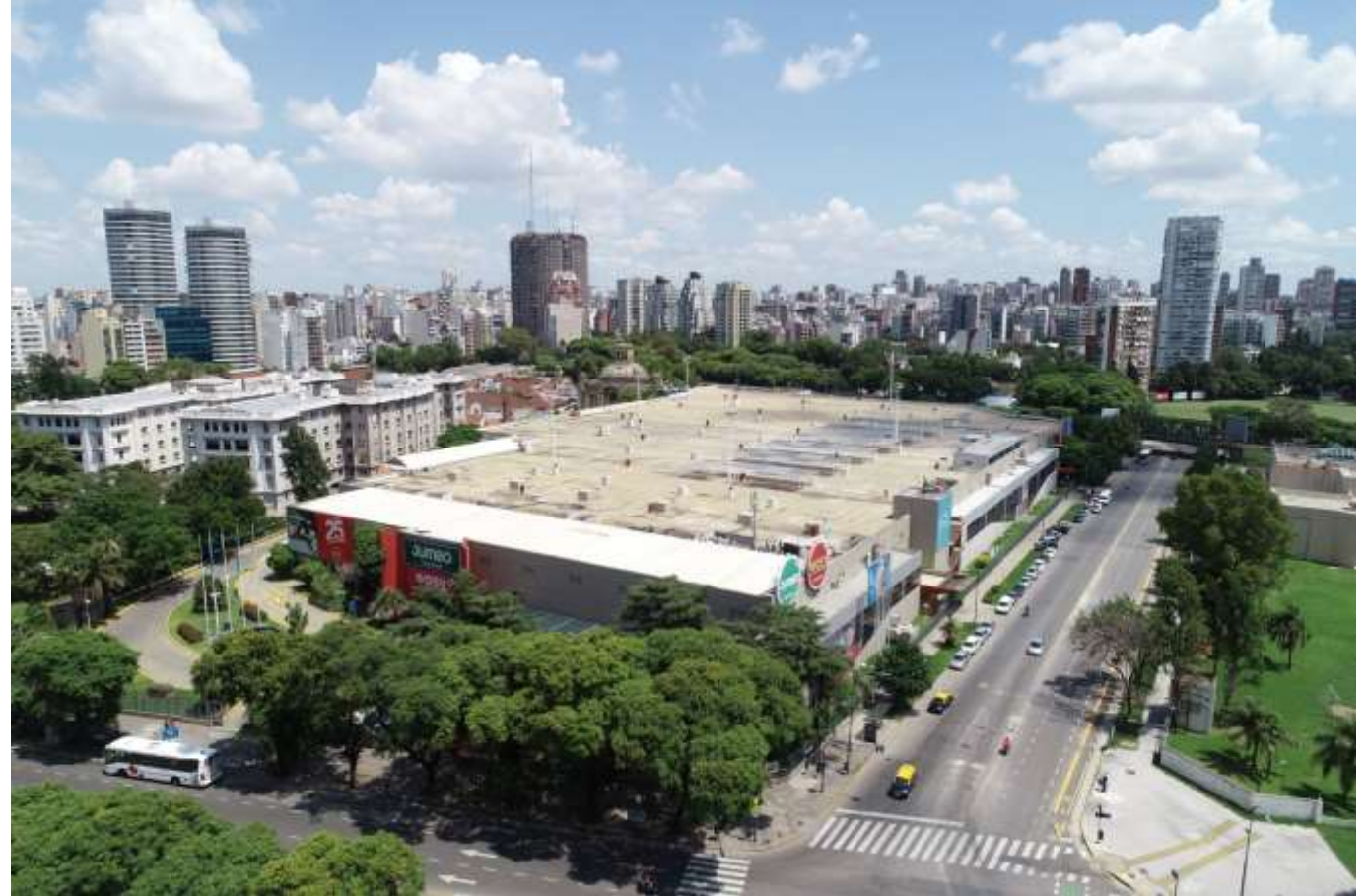
Imagen 7- Perspectiva aérea sobre calle Cerviño.