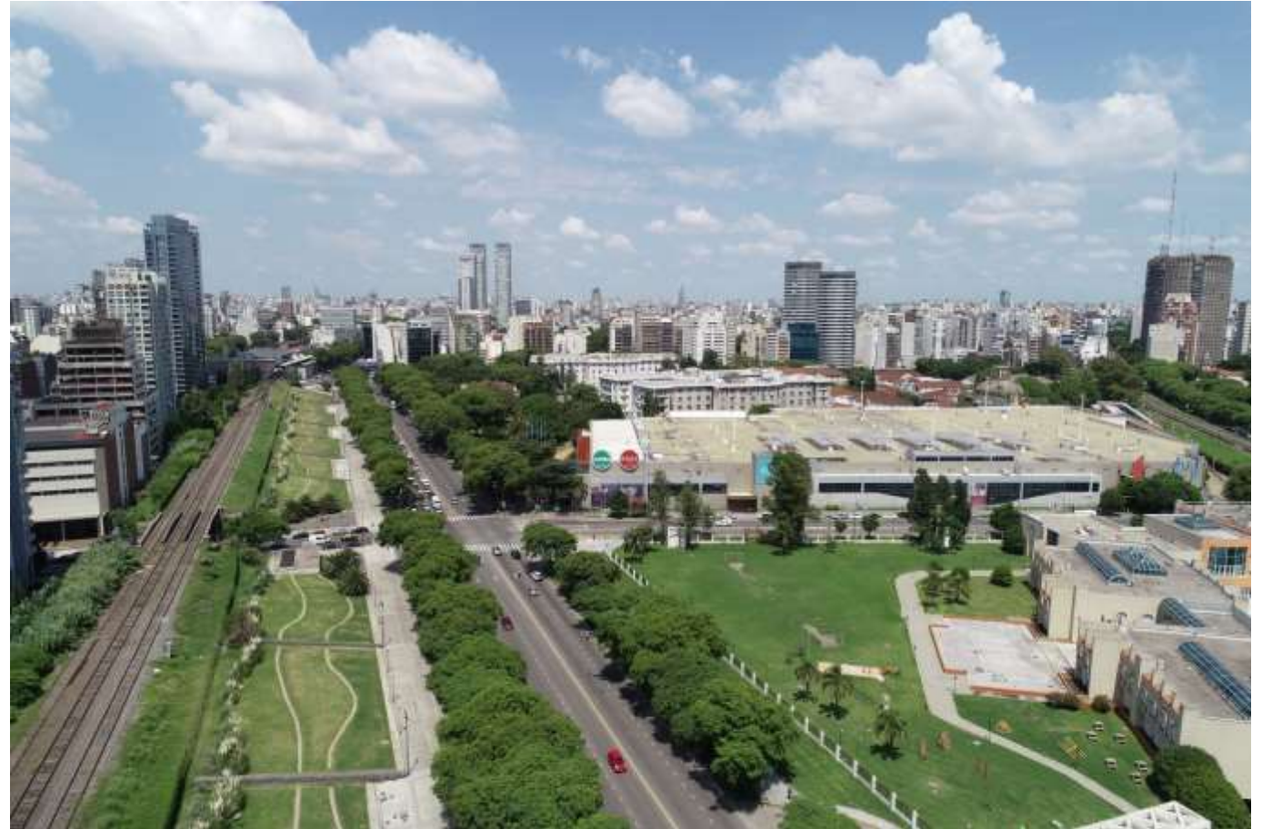
Imagen 9- Perspectiva aérea sobre Av. Int. Bulrich.