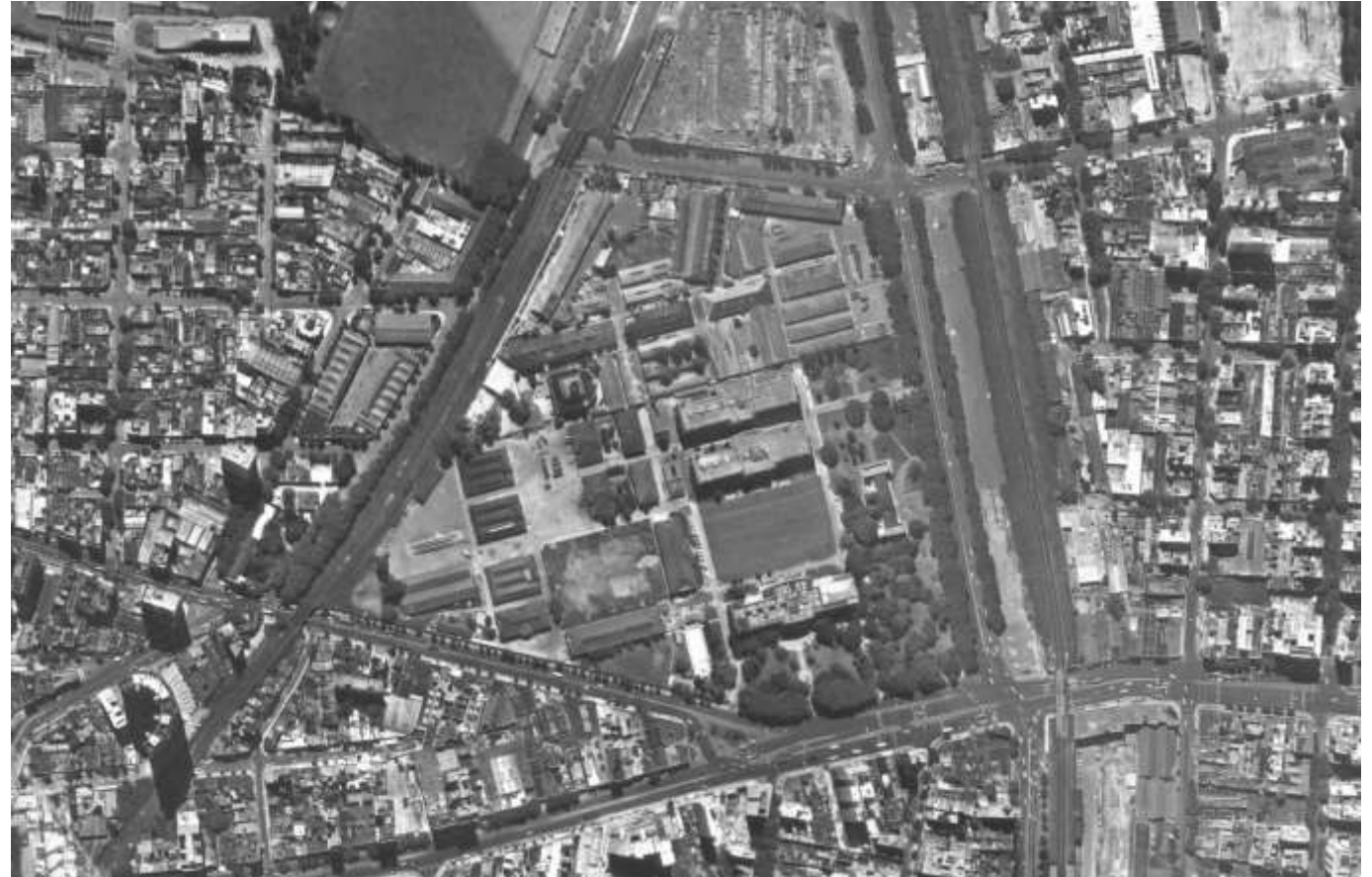
Imagen 3- Vista aérea año 1978.