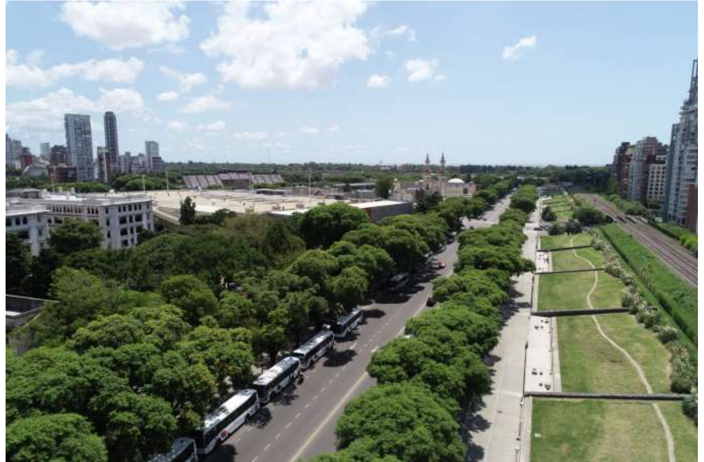
Imagen 10- Perspectiva aérea sobre Av. Int. Bulrich desde Av. Santa Fe.