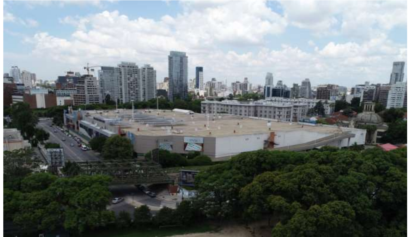
Imagen 11- Perspectiva aérea sobre proyección Av. Cerviño y Av. Dorrego.