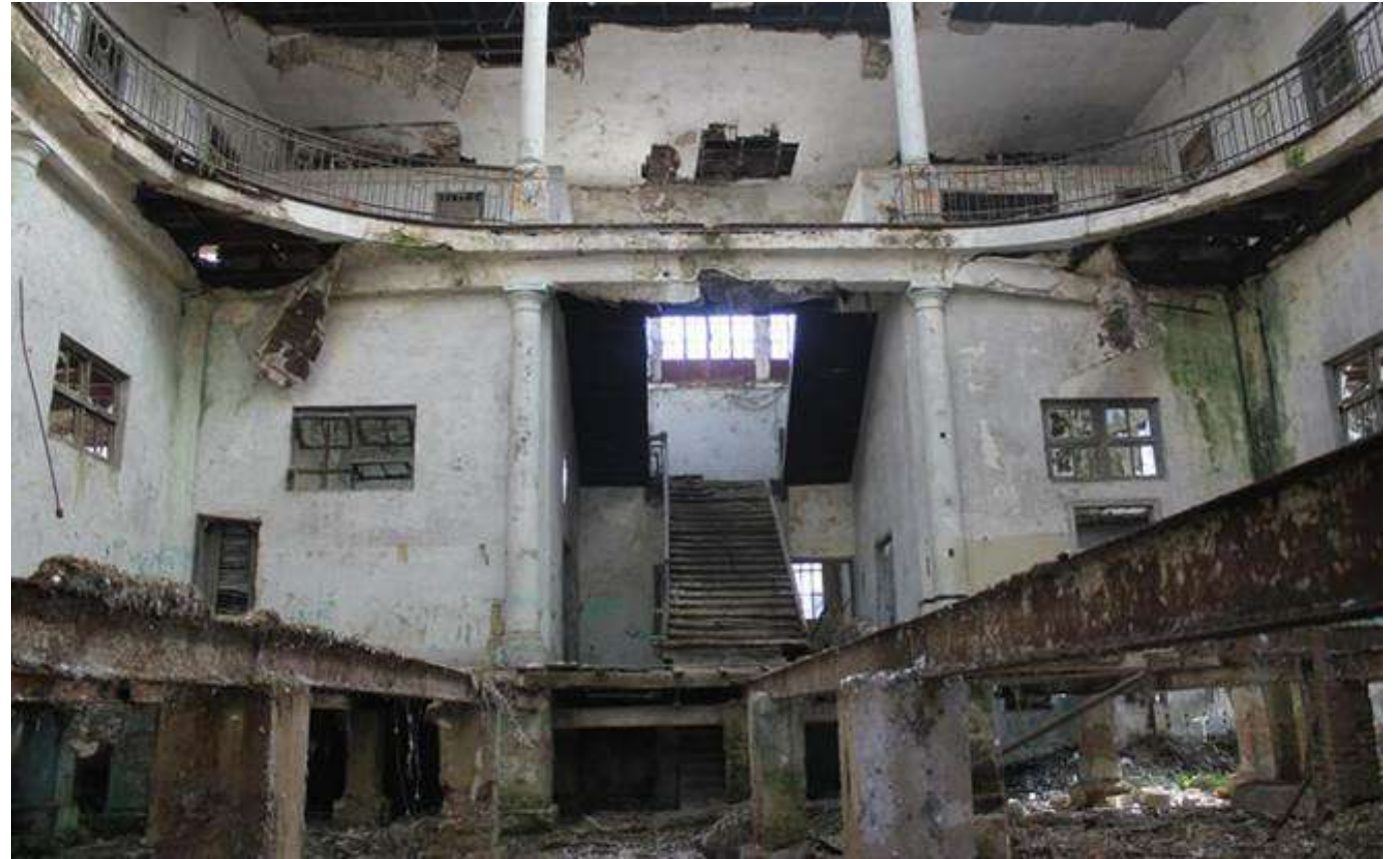
Imagen 16. Vista interior situación actual.