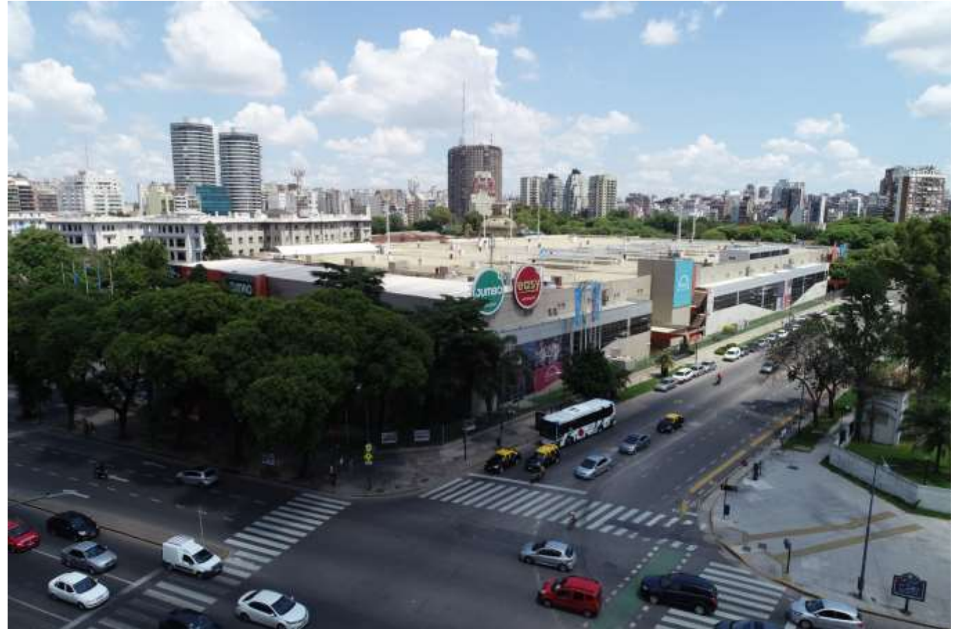
Imagen 8- Perspectiva aérea sobre calle Cerviño intersección Av. Int. Bulrich.