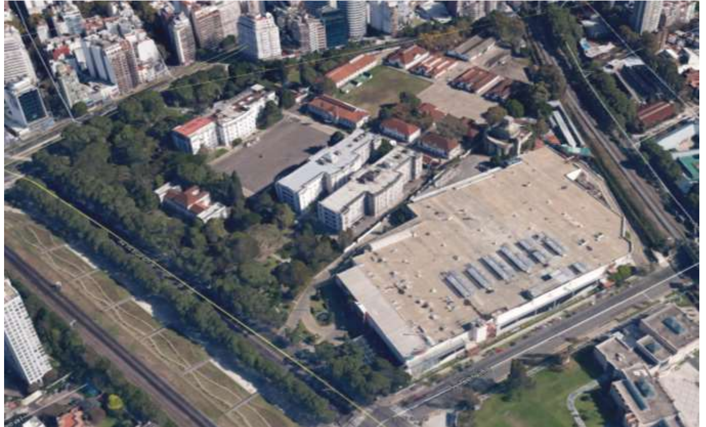
Imagen 6- Perspectiva aérea sobre Av. Cerviño y Av. Int. Bulrich.