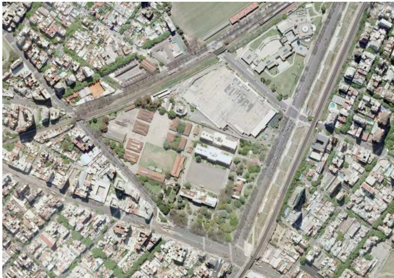
Imagen 4- Vista aérea año 2009.