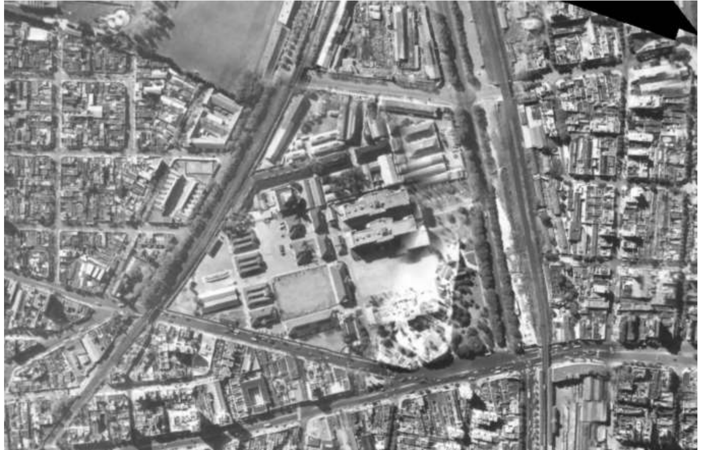
Imagen 2- Vista aérea año 1965.