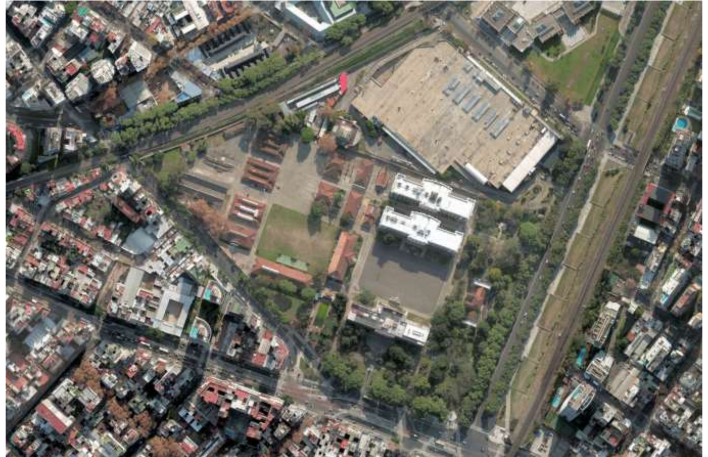
Imagen 5- Vista aérea año 2017.