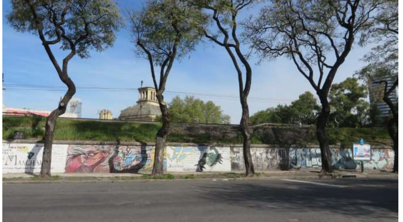
Imagen 14- Vista desde Av. Dorrego.