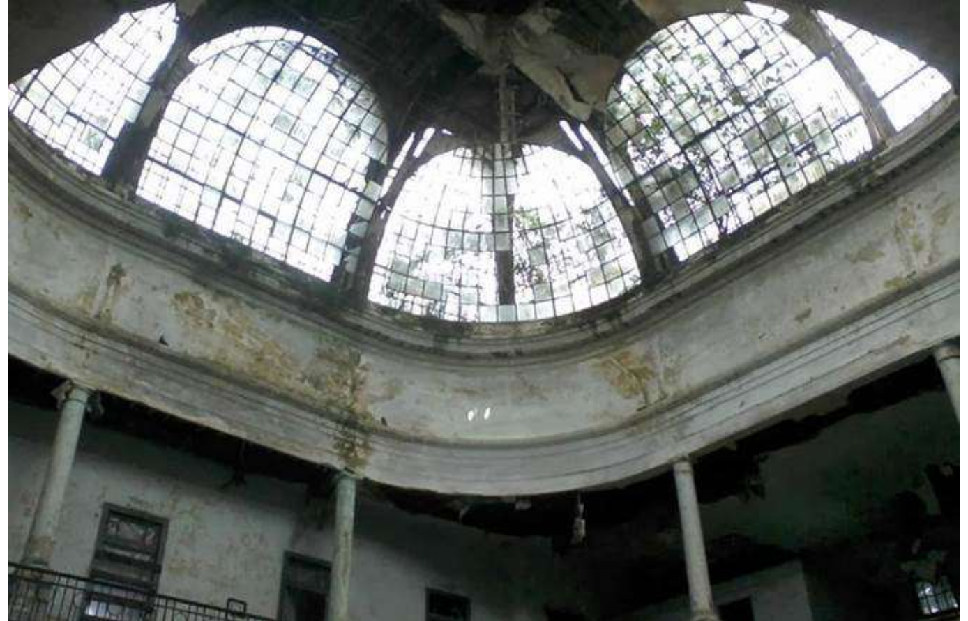
Imagen 15. Vista interior situación actual.