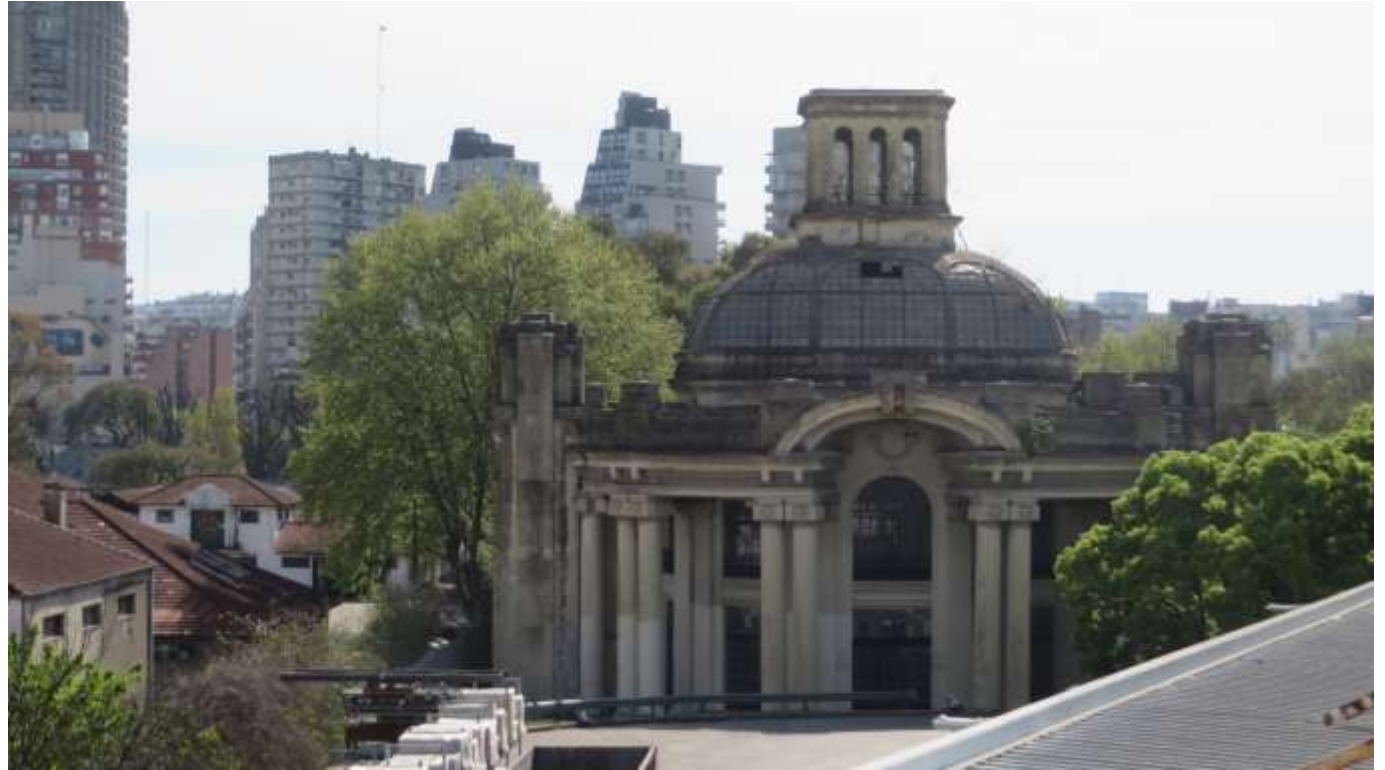
Imagen 12- Acceso principal