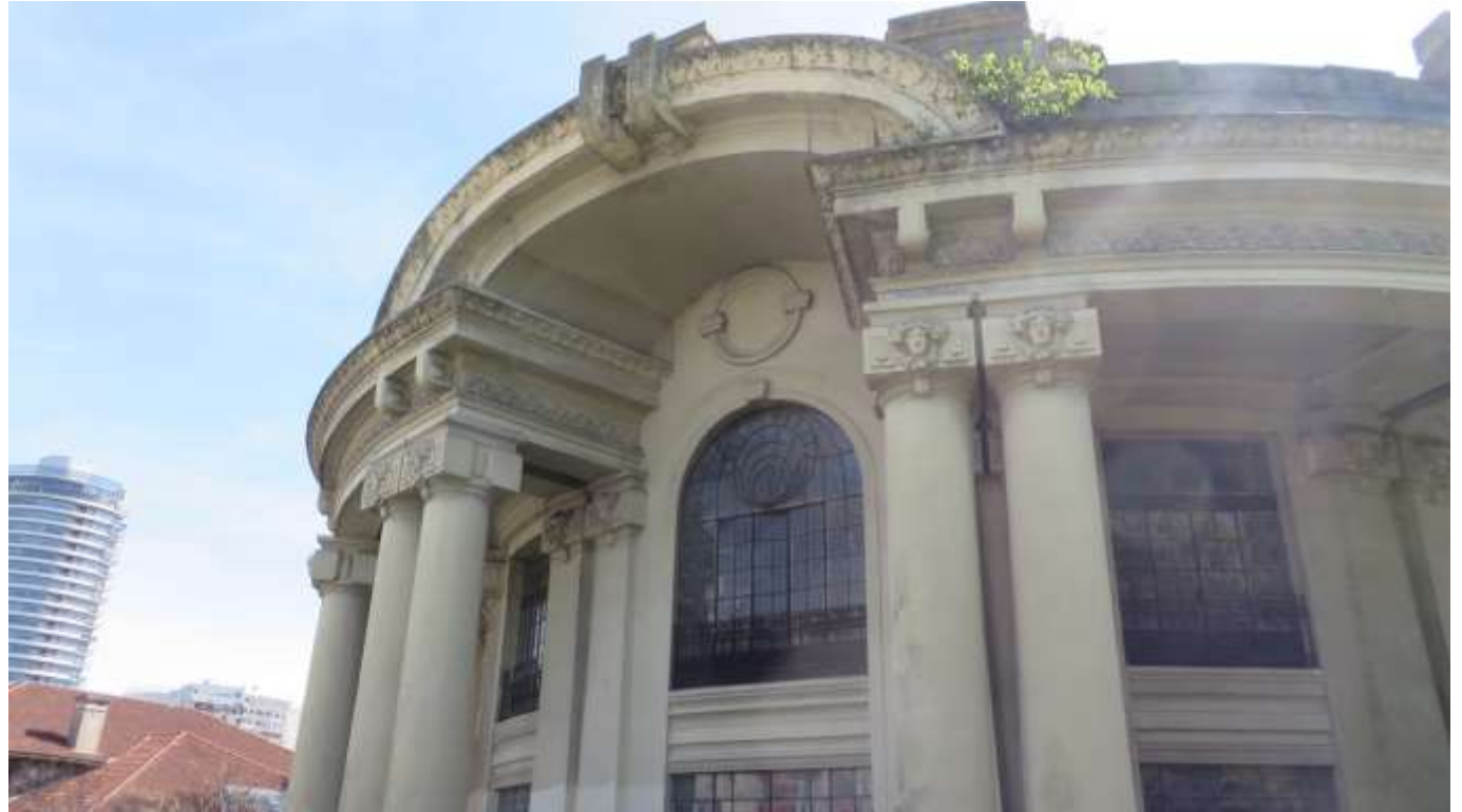
Imagen 13- Detalle acceso principal