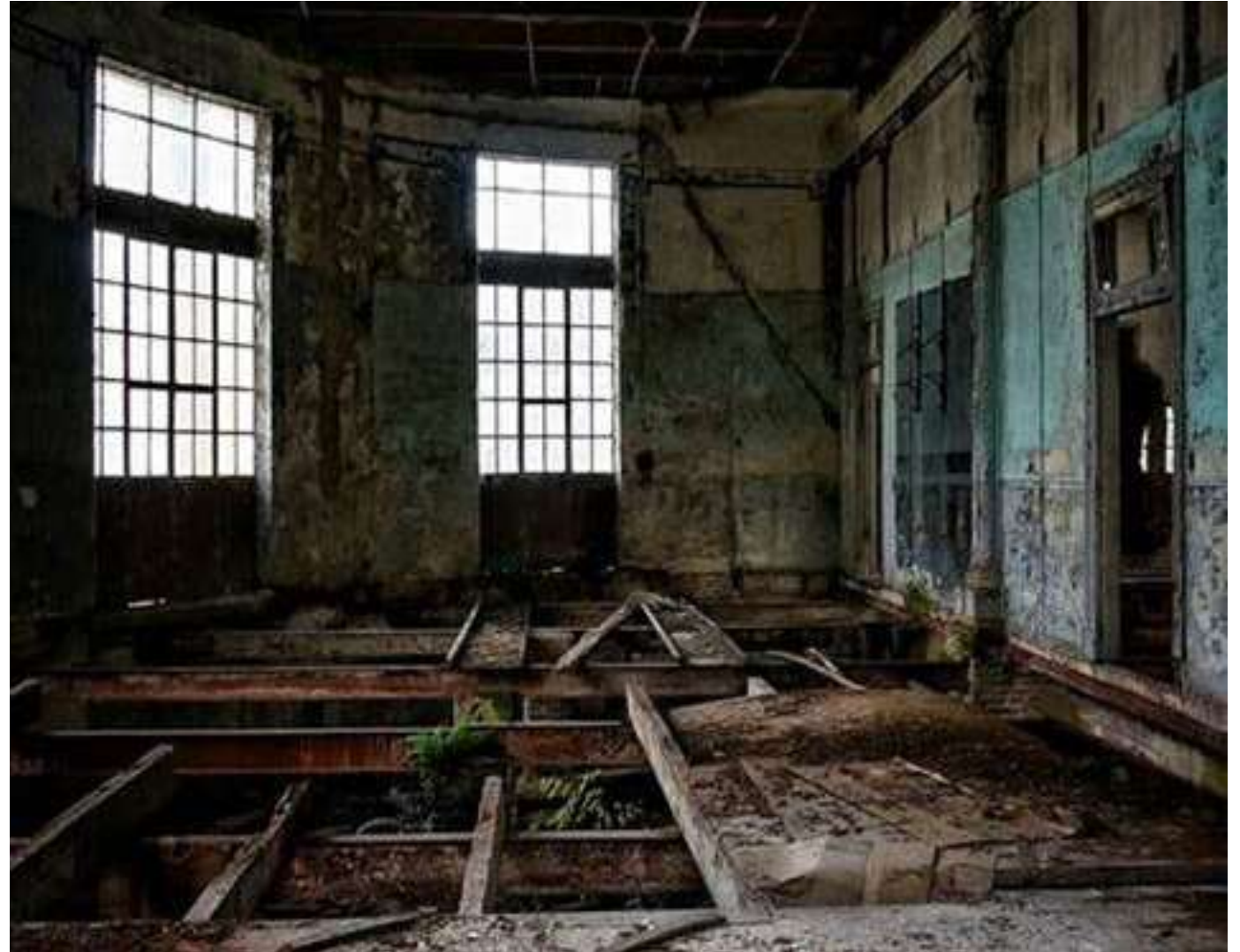
Imagen 17. Vista interior situación actual.